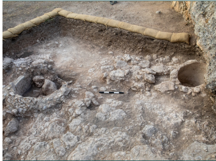
8. מתקנים עגולים חצובים, מבט לדרום-מזרח. (Images//G46-8.jpg)