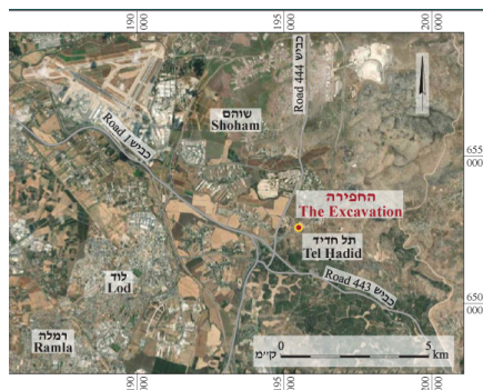
1. מפת איתור. (Images//G46-1a.jpg)