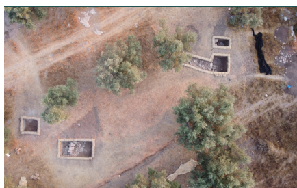
5. שטח BB, מראה מהאוויר לצפון. (Images//G46-5.jpg)