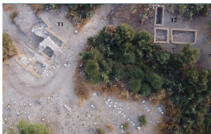
10. שטחים T1 ו-T2, מראה מהאוויר לצפון. (Images//G46-10.jpg)

אבן מרובעת ומסותתת, שהייתה כנראה מכוסה במקור בטיח; היא נחסמה חלקית בסלע גדול. פתח הבור מוביל לפיר אנכי רחב ורבוע, שהופך מעוגל בחלקו התחתון (איור 12). על דופן הפיר, בעומק כ-3 מ' מתחת לפתח, השתמרו קטעי טיח, ונמוך יותר הובחנה השתמרות מלאה יותר של הטיח על הדופן. התגלתה שכבה של חרסים שהודבקו לדופן הפיר, ומעליה שתי שכבות טיח: שכבה של טיח אפרפר ושכבה עליונה של טיח אדמדם שלו גריסים בולטים. הפיר מוביל לחלל אופקי ובו שני חדרים מרובעים שנחצבו בציר צפון-מזרח-דרום-מערב. דופנות החדרים, קרקעיתם ותקרתם טויחו בטיח הדומה לזה שבפיר. בקרקעית החדרים נחשף רובד של חרסית (סנטימטרים אחדים-2 מ' עובי בחלק שמתחת לפיר), שהצטבר בשקיעה שקטה של חומרים דקים ישירות מהמים שנאגרו בבור, ומכאן שקשור לזמן השימוש בבור. מתחת לפתח הפיר נחשף שפך דמוי חרוט של קרקע, סלעים, חומר אורגני ופסולת רבה, שחדרו מפני השטח לבור לאחר שזה יצא משימוש. ראשו של השפך מתחת לפתח הפיר ותחתיתו גולש לתוך החדרים. הפסולת בשפך כללה למשל שברי קנקנים מהתקופה העות'מאנית, קסדת מתכת מימי המנדט הבריטי ובקבוקי פלסטיק מימינו.