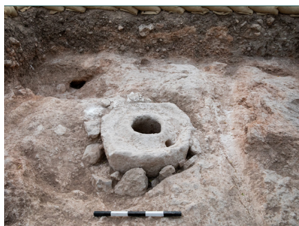
4. מתקן למיצי שמן זית, מבט למזרח. (Images//G46-4.jpg)