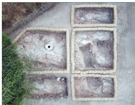
3. שטח AAU, מראה מהאוויר לצפון. (Images//G46-3.jpg)