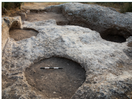
9. מתקנים עגולים שנחצבו אל תוך מחצבה, מבי לצפון. (Images//G46-9.jpg)