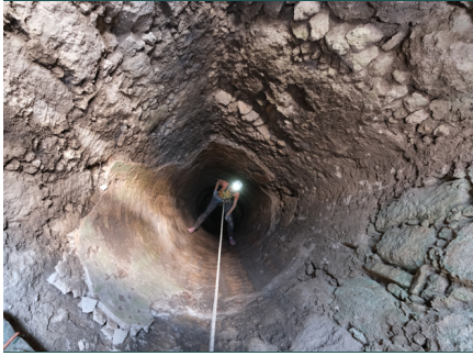
12. פיר בור המים. (Images//G46-12.jpg)