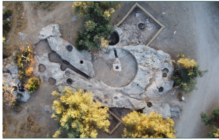
7. שטח CC, מראה מהאוויר לצפון-מזרח. (Images//G46-7.jpg)