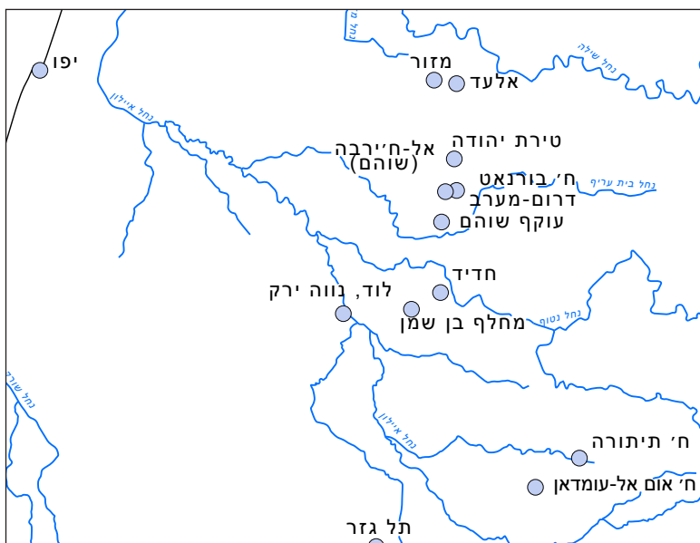
איור 1: מפת מיקום תל חדיד ואתרי מפתח. הכנה: שגיא פריימן, הפרויקט הארכיאולוגי בתל חדיד