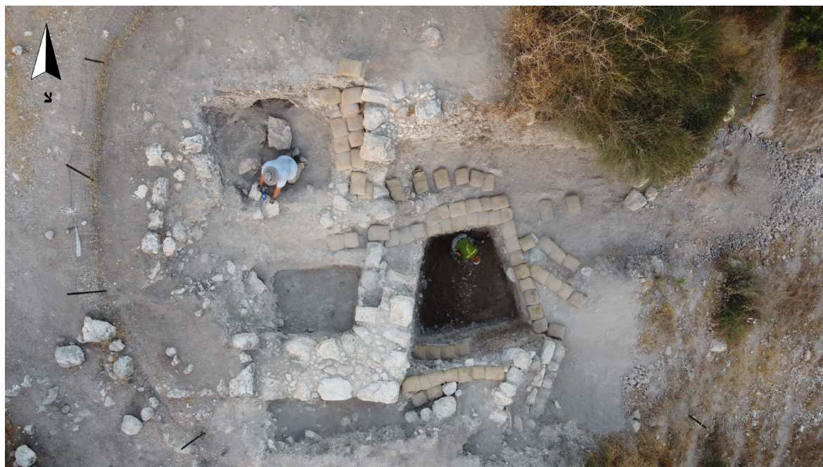
איור 3: שטח T1 ומבנה T1/F3500 בסוף עונת חפירות 2023, מבט לדרום.

החפירות שנערכו אל תוך המישורת, בשטחים T1 ו-T2, הצביעו על היווצרות מישורת העפר כמפעל בנייה שהוצמד אל התל. מבנה T1/F3500 פינתי וקירותיו העבים (1.2 מ') בנויים מאבני שדה מסותתות גס שביניהן אבני שדה קטנות יותר וחומרי מליטה. עקב מיקומו האסטרטגי של המבנה וסגנון בנייתו, ניתן לתארו כביצור קטן. במהלך שלוש עונות החפירה תוארכו המבנה והמילויים שלו על פי טיפוסי הקרמיקה המאוחרים ביותר לתקופה החשמונאית, לא לאחר אמצע המאה הראשונה לפסה"נ. לא נמצא מפלס חיים בתוך המבנה והתיארוך מתבסס אך ורק על המילויים בתוך המבנה ומחוצה לו. התמונה דומה גם בשטח T2, שבו נחפרו מילויים הניגשים אל קיר הדומה מבחינה אדריכלית לקירות בשטח T1. גם מילויים אלו תוארכו על סמך הממצא הקרמי המאוחר ביותר לתקופה החשמונאית ולא לאחר אמצע המאה הראשונה לפסה"נ.