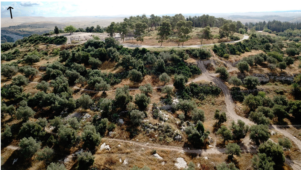
איור 2: תל חדיד - מבט לצפון. משמאל לתל המקורי ניתן לראות את מישורת העפר (צבעה בהיר יותר).