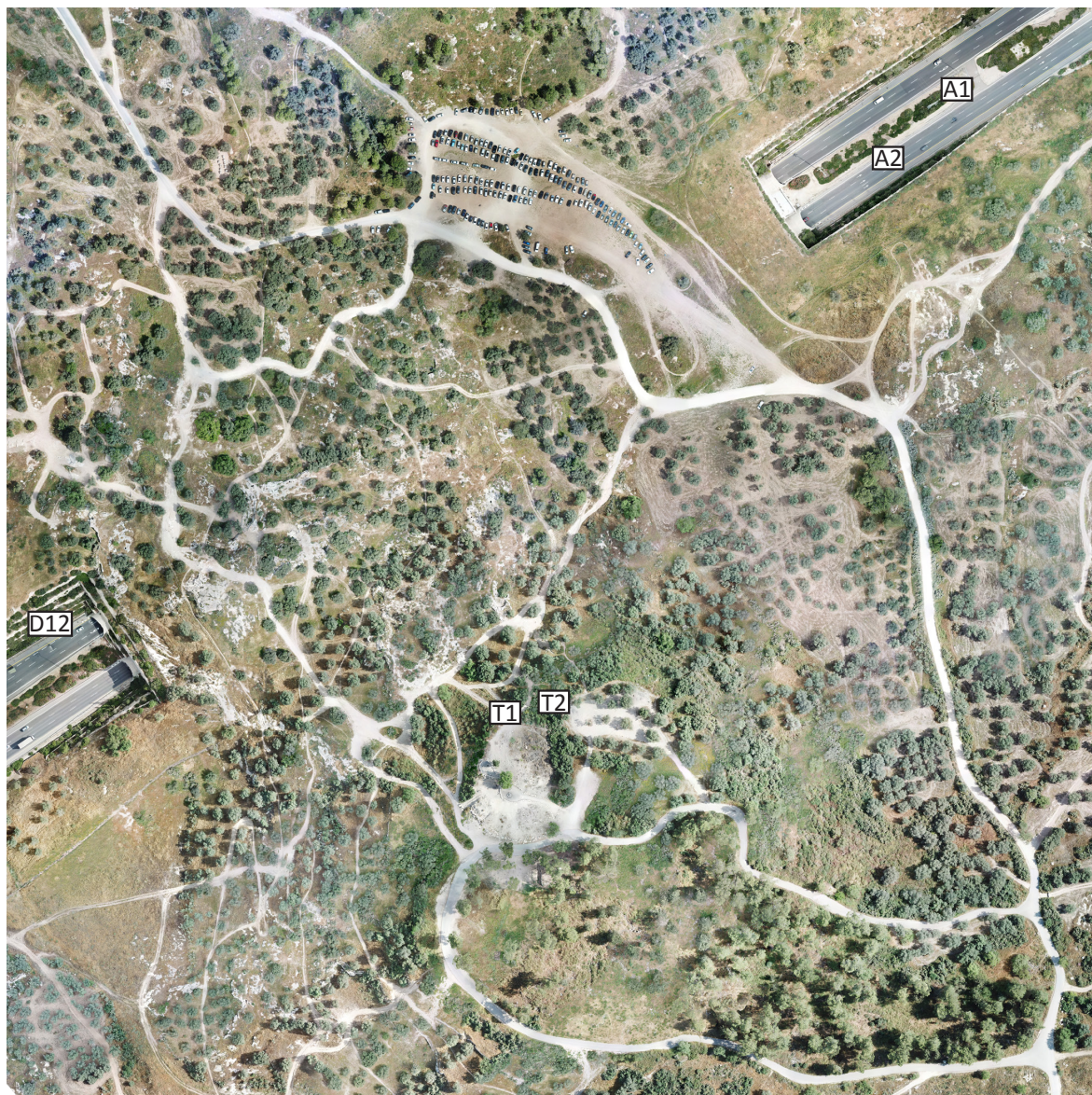
איור 4: שטחי החפירה בתל חדיד. אורתופוטו מאת עומר זאבי-ברגר, הפרויקט הארכיאולוגי בתל חדיד

אל מישור החוף, הראיות החומריות אינן משקפות זאת. כאמור, לפי ממצא כלי החרס המאוחרים ביותר בשכבות המילויים יש לתארך את הקמת המישורת והביצור למחצית הראשונה של המאה הראשונה לפסה"נ (או ממש לשנים האחרונות של המאה השנייה), ומבחינה היסטורית לימיו של אלכסנדר ינאי. עם זאת, חשוב לסייג את התיארוך ולציין כי מכיוון ששטח החפירה קטן יחסית, ייתכן שהתמונה חסרה. כלומר, אפשרות סבירה היא שבחפירה נחשף רק חלק מן הביצור אשר נבנה או שופץ בתקופת ינאי. ייתכן כי היה מבצר קדום יותר (במיוחד לאור הממצאים החדשים מעונת 2023 בשטח T2), שבינתיים אינו מזוהה כראוי.